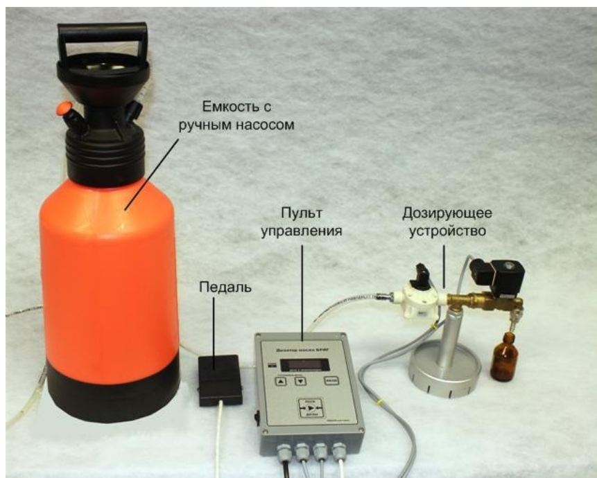
Рис 1: Общий вид дозатора

Дозирующее устройство состоит из расходомера, осуществляющего непосредственное измерение потока протекающей через него жидкости, и отсечного электромагнитного клапана, пускающего и останавливающего поток жидкости.