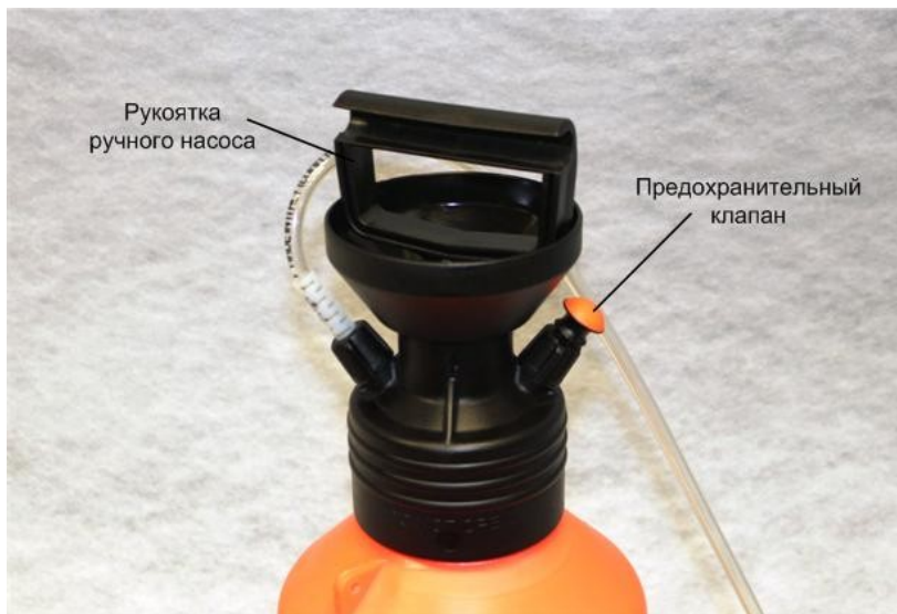
Рис 3: Емкость для жидкости с ручным насосом